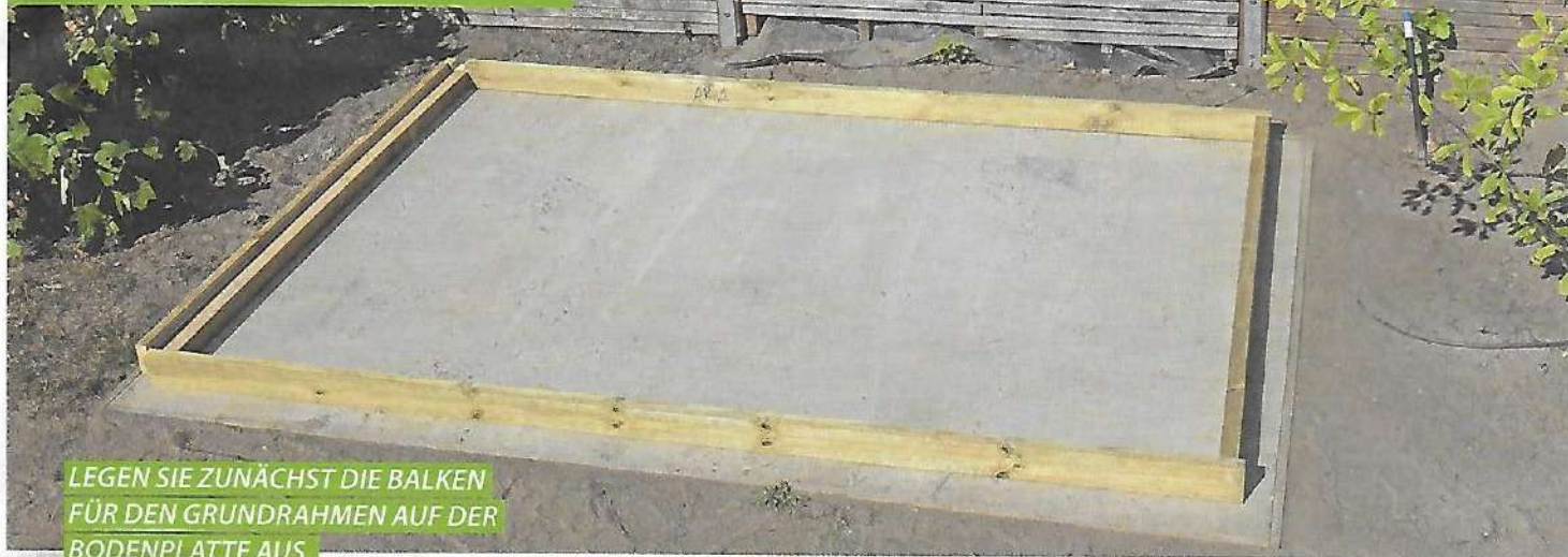
LEGEN SIE ZUNÄCHST DIE BALKEN FÜR DEN GRUNDRAHMEN AUF DER BODENPLATTE AUS.