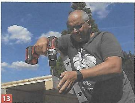
13 Alternativ zum Nageln können Sie die Bretter auch mit dem Akkubohrschrauber an die Sparren schrauben.