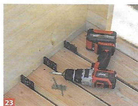
23 ... Bereich ist je eine Ausklinkung vorzunehmen. Um für einen gleichmäßigen Abstand der Bretter zu sorgen, legen ...