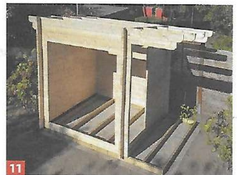
11 Hier sehen Sie die fertig eingesetzten Dachsparren. Sie ragen an der rechten Seite heraus und bilden das Vordach.