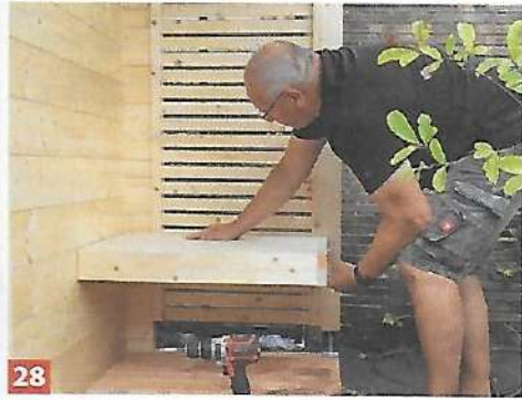
28 Auf diese Holzleiste wird nun das Sitzelement gesetzt.