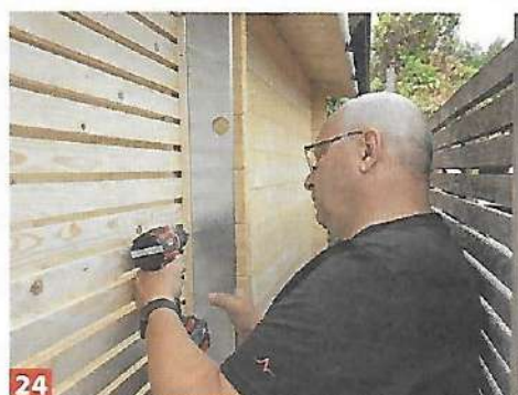
24 ... Sie Gummigranulatpads zwischen die Bretter. Im Eingangsbereich wird an einer Seite noch ein Sichtschutzelement an ...