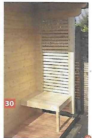
30 Fertig ist der Eingangsbereich, nun kann drinnen weitergearbeitet werden.