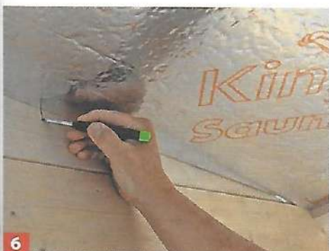
6 ... Aluminiumband zugeklebt. Markieren Sie zudem, wo die Dachsparren liegen.