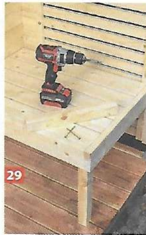
29 Zum Stützen des Sitzelements wird ein Fuß unter das Element geschraubt.