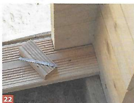
22 Unter dem Vordach werden nun die Bodenbretter an die Fundamentbalken geschraubt. Im vorderen und hinteren ...