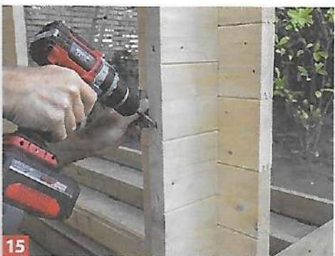
15 Für mehr Stabilität der Wände werden auf der Innenseite der Laibungen Schrauben schräg in die Bohlen gedreht.