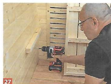
27 Zudem wird unter dem Vordach eine Bank angebracht. Dazu schrauben Sie zuerst eine Holzleiste an.