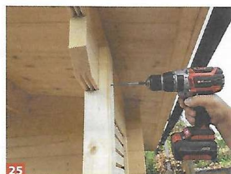
25 ... die Hauswand und an den letzten Dachsparren geschraubt.