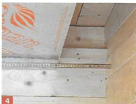
4 An einer Seite mussten die Dämmplatten zugeschnitten werden. Messen Sie dazu die Lücke aus, schneiden die ...