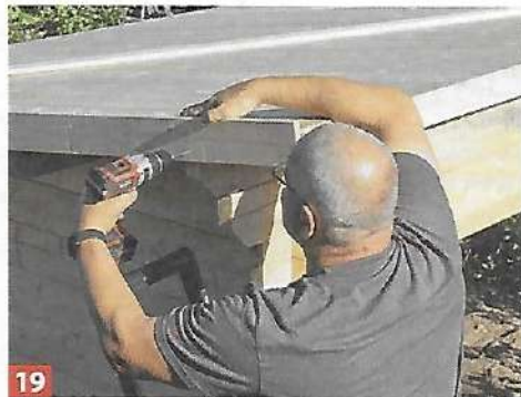
19 ... und montieren Sie sie rund um das Dach des Saunahauses.