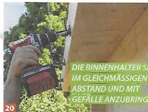
20 DIE RINNENHALTER SIND IM GLEICHMÄSSIGEN ABSTAND UND MIT GEFÄLLE ANZUBRINGEN.