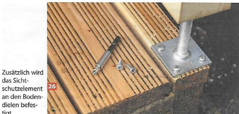
26 Zusätzlich wird das Sichtschutzelement an den Bodenplatten befestigt.