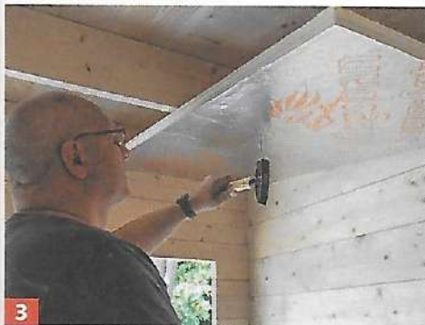
3 Nun werden die Dämmplatten von unten an die Dachsparren genagelt.