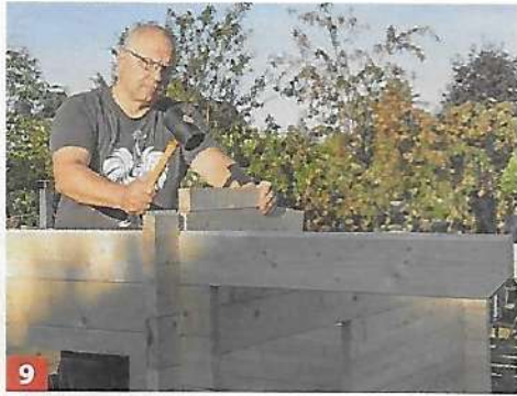
9 Setzen Sie nun den ersten Dachsparren ein und darüber die Abschlussbohlen.