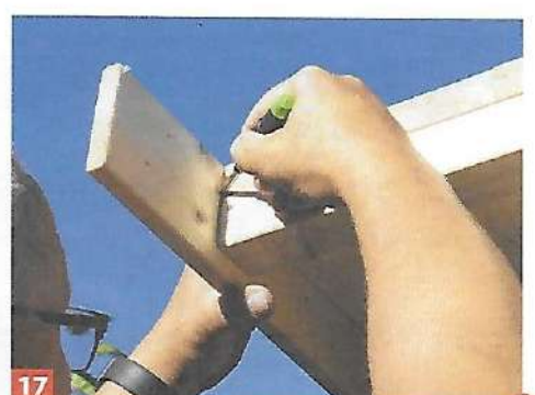
17 Halten sie die Dachblenden probe- weise an und markieren Sie den Über- stand.