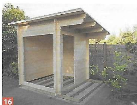
16 Zwischenstand: Der Korpus der Sauna samt Dach ist nun aufgebaut. Am Dach fehlen nur noch die Blenden.