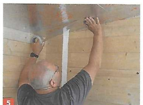
5 ... Platten zu und nageln sie an. Als Dampfbremse werden dann die Schlitzze zwischen den Dämmplatten mit ...