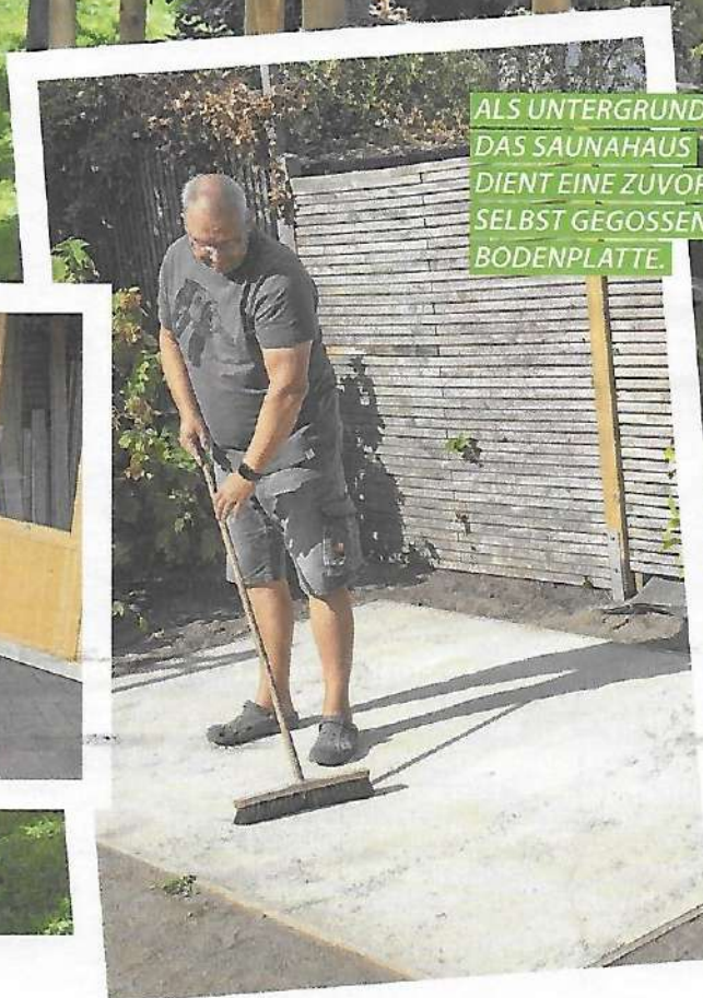
ALS UNTERGRUND FÜR DAS SAUNAHÄUS DIENT EINE ZUVOR SELBST GEGOSSENE BODENPLATTE.

Text: Marie Mittelstadt; Fotos: Michael W.