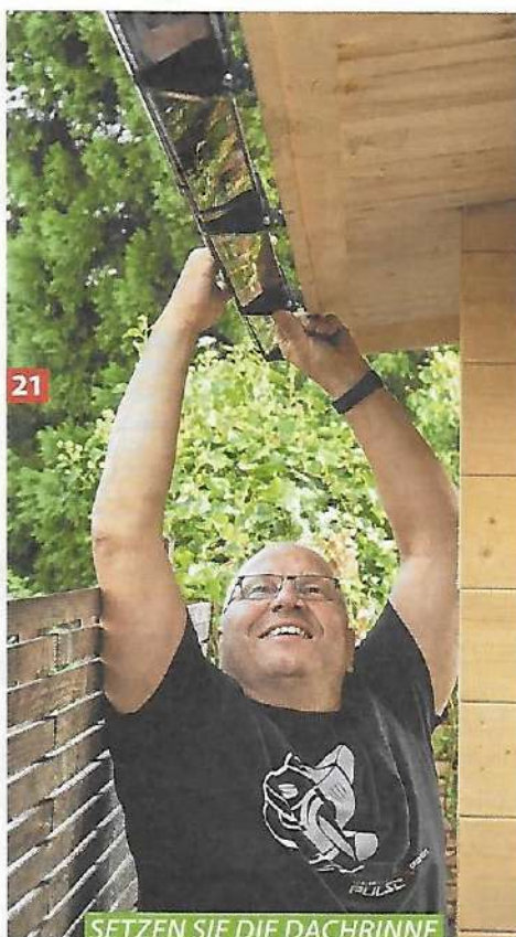
21 SETZEN SIE DIE DACHRINNE EIN UND ZIEHEN DIE RINNENHALTER FEST.