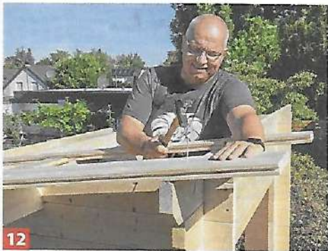
12 Nun werden die Dachbretter aufgelegt und an die Sparren genagelt.