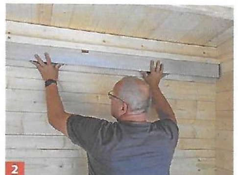
2 Überprüfen Sie mit der Wasserwaage, ob die Leiste in der Waage liegt.