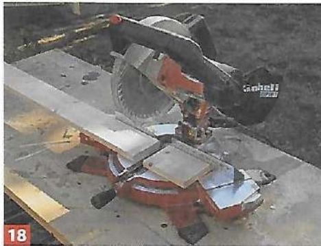
18 Schneiden Sie anschließend die Blenden mit der Kappsäge zu ...