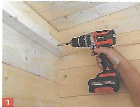
1 Zuerst werden im Hausinneren Leisten angebracht, an denen die isolierte Saunadecke befestigt wird.

Nachdem nun der Hauskorpus der Sauna samt Eingangsbereich fertig aufgebaut wurde, ist der Innenbereich an der Reihe. Hier ist die Dämmung der Decke und des Bodens anzubringen und anschließend zu verkleiden.